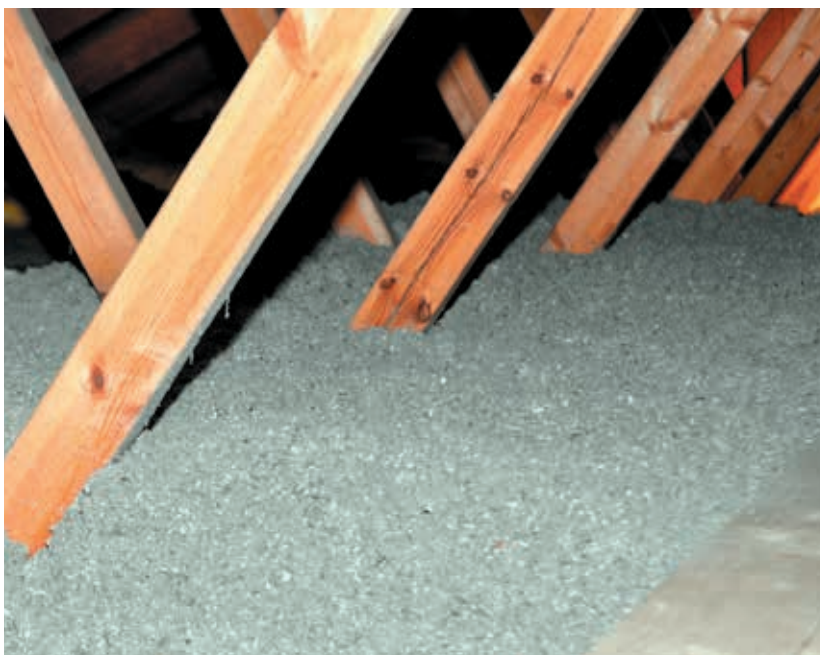
Loft efter indblæsning af Themofloc papirisolering