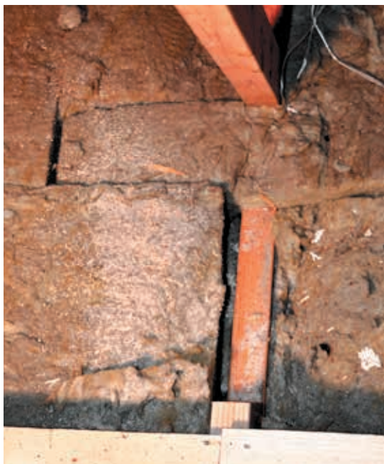
Loft før indblæsning af Themofloc papirisolering