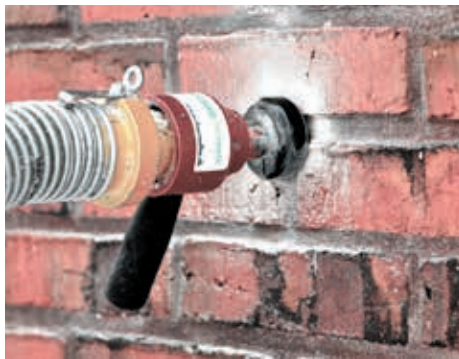
Papirisoleringen blæses ind i hulumuren.