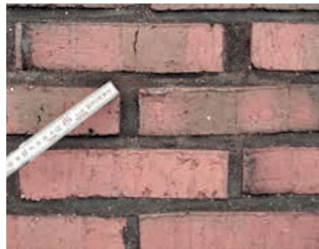
Ilægning af fuge, så det passer i mørtelfarve.