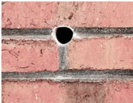
Kun et lille hul i fugen er nødvendig.

Thermofloc papirisolering er et organisk materiale og kan derfor absorbere fugten i en hulmur. Kort sagt vil fugten blive transporteret til et større område i hulumuren og vil blive afgivet igen, når forholdene tillader det. Man undgår derfor fugtskader.